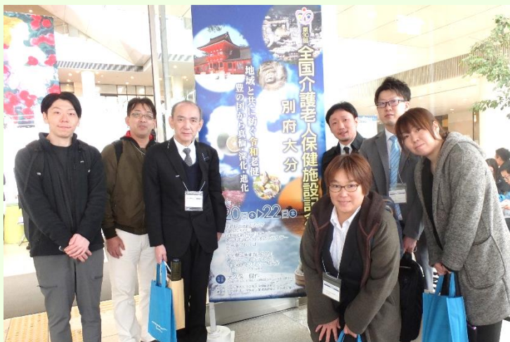
2019年11月20～22日 全国老人保健施設大会 大分