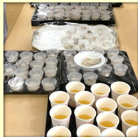
とろみ付きルゾージュース、栄養補助ゼリーの試食もあります