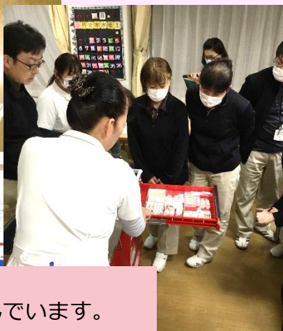
救急カートの中身 医薬品等が整然と並んでいます。