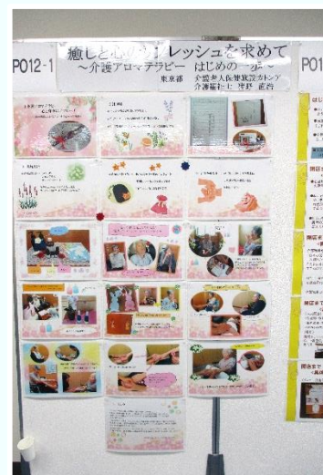
ポスター発表の写真